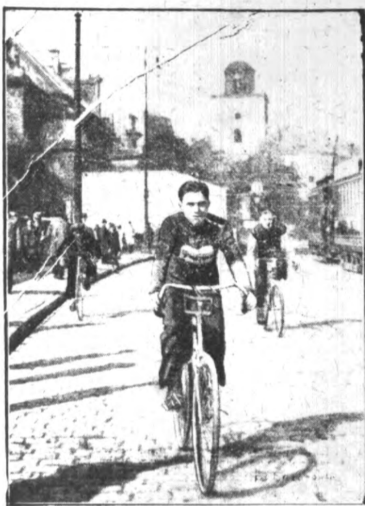
Gazeciarze trenują pilnie do naszego niedzielnego biegu kolarskiego.

Już w najbliższą niedzielę stolicę będzie świadkiem niezwykłego widowiska sportowego, którego bohaterami będą znani i lubiani w Warszawie — kolporterzy gazet na rowerach. Wyścig ten organizowany jest przez Redakcję pisma naszego i redakcję „Kurjera Porannego” pod punktualnie o godzinie 9-ej rano przed gmachem redakcji pisma naszego na Placu Dąbrowskiego. Kilku uproszonych przez redakcję lekarzy zbada zawodników, którzy otrzymają następnie numery, szarfy i paczki z gazetami.