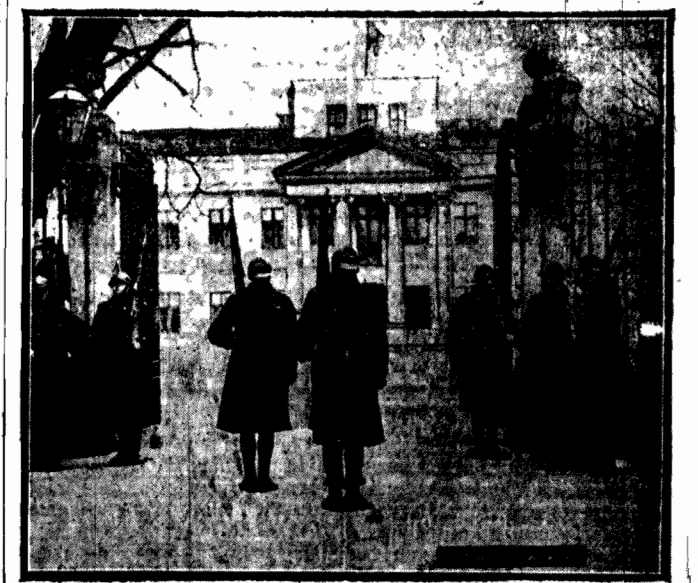
ZMIANA WARTY W BELWEDERZE

Wreszcie delegację Wytwórni amunicji karabinowej na Pradze, która wręczyła Marszałkowi ozdobny album fabryki z dedykacją.