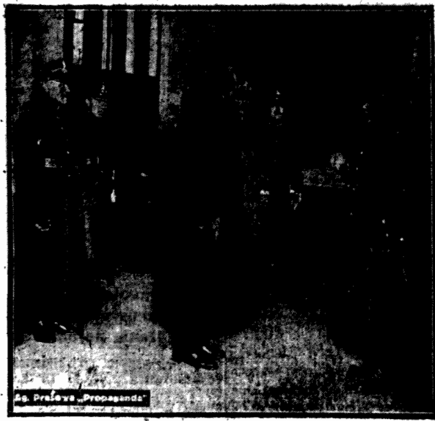
PREZYDENT RZECZYPOSPOLITEJ O BCHOZI WARTY

Dewizy Berlin 1.90, Belgia (za 100) 35.00, Holandia (za 100) 300.00, Londyn (za 1) 40.00, Paryż (za 100) 30.00, Praga (za 100) 23.00, Szwajcaria (za 100) 145.00, Wiedeń (za 100) 1.07, Sztokholm (za 100) 200.00, Włochy (za 100) 31.00.