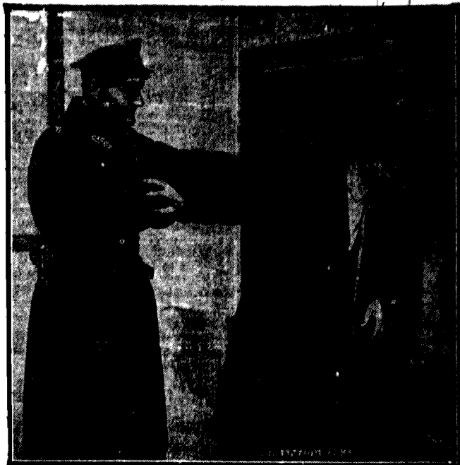
JAPOŃSKI CHWYT DO POLSKIEJ KOZY

Przejdźmy jednak od paradoksów do cyfr: według danych podatkowych w r. 1924 Warszawa wypila wódki w różnych postaciach 8,329,677 litrów, co sta-