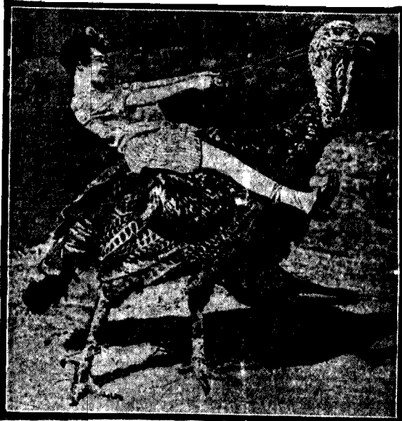
NA NAJWIĘKSZYM INDIKU

Sally O'Neill znana aktorka filmowa o filigranowej postaci, uprawia narce na pięknym indyku, przeznaczonym do spożycia w czasie tradycyjnego obiadu Bożego Narodzenia.