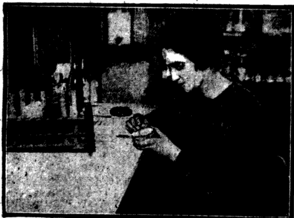
P. Irena Curie, utalentowana chemiczka

Starsza, dwudziestoletnia Ewa Curie, zdradza wielki talent, jako pianistka i zamierza niebawem dać szereg koncertów, których za powiedz jest dla świata muzycznego Paryża ogromną sensacją.