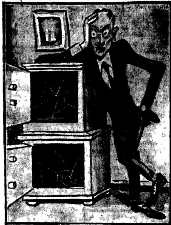
— Klótnie i klótnie... Co też z tego wyniknie?