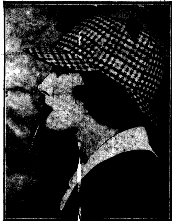
Takich cudaków spotyka się w Ameryce co krok. Czapka „szerloholmińska” — krzyk mody „sportgirls” (sportowiczki).