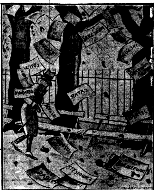
Lecą nście z drzew w... ogrodzie Sejmowym...