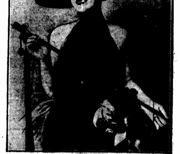
Jedna z najznakomitszych amerykańskich artystek dramatycznych, panna Norma Shearer, występuje obecnie w roli, do której przywdziała oryginalny kostjum, zwany popularnie przez bywałoów teatralnych „kostjumem wampira”. Strój ten stanowi odpowiedź na adreju przywłaszczono.