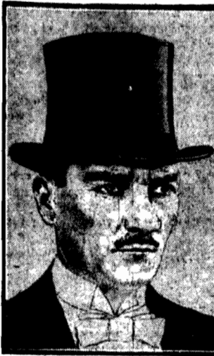
Kemal - Pasza prezydent republiki tureckiej wystąpił po raz pierwszy publicznie w cylindrze.

Prezydent Turcji po raz pierwszy w cylindrze