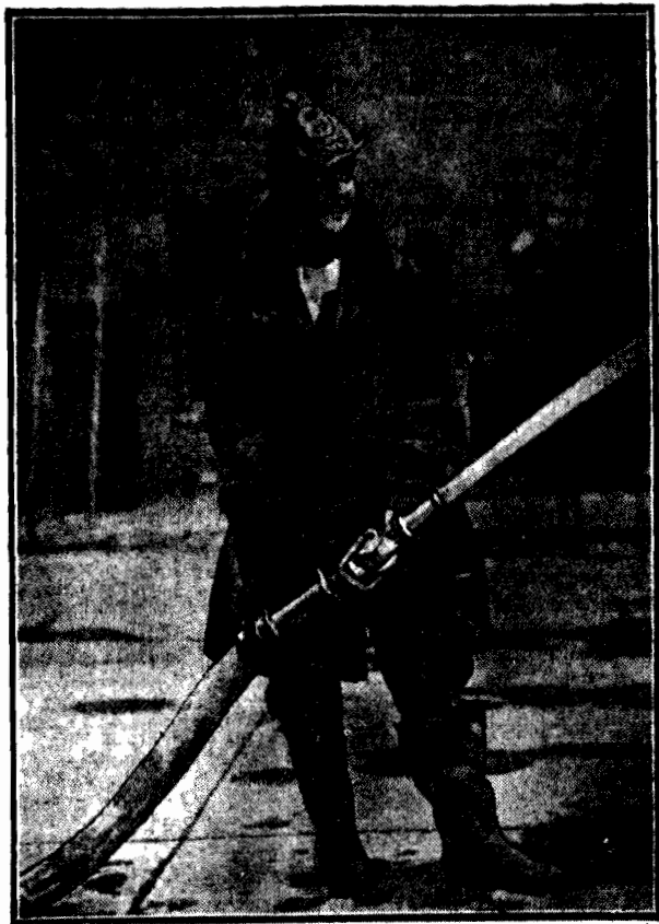
Straż pożarna słynnej amerykańskiej miejscowości kąpielowej, Atlantic City, położonej w stanie Nowego Jorku, miała w swym składzie od kilku lat działającą ochotniczkę, która była beniaminkiem całego oddziału. Niedawno straż wybrała swą faworytkę na komendantkę i powierzyła jej dowództwo oddziału.