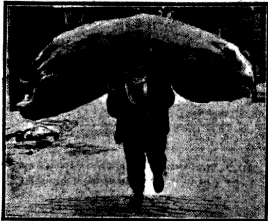
Turecki tragarz spieszy przez ulice Stambułu, uginając się pod ciężarem. Prawda, że budzi współczucie? Otóż — niesłusznie. Tragarze w Turcji pracują ciężko, ale fotografia nasza przedstawia moment kiedy jedne-

mu z nich udało się znaleźć pracę nie tak ciężką. Tragarz ten dźwiga wielki wór... słomy.