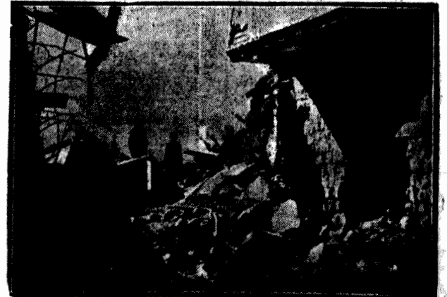
Oto jedno z najbardziej wstrząsających zdjęć, przedstawiających znacznie straszną ruinę Damaszku, który z kwitnącej i rześkiej stolicy kraju, stał się po strasznym bombardowaniu przez artylerię francuską, łupą i ruinami. Na ulicy i ruinach.