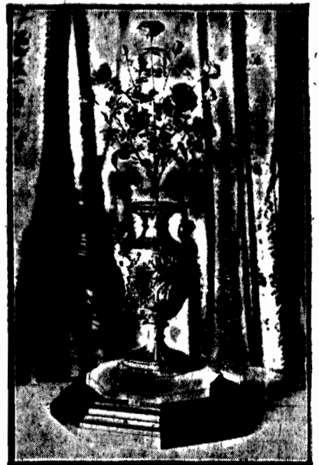
Papież zamierza ofiarować królowej Elżbiecie belgijskiej z okazji jej srebrnego wesela „Złotą różę”, — najwyższe odznaczenie, ofiarowywane dla członków katolickich domów panujących.