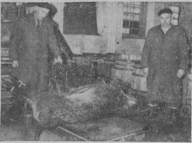
Na wadze dzik odyniec.