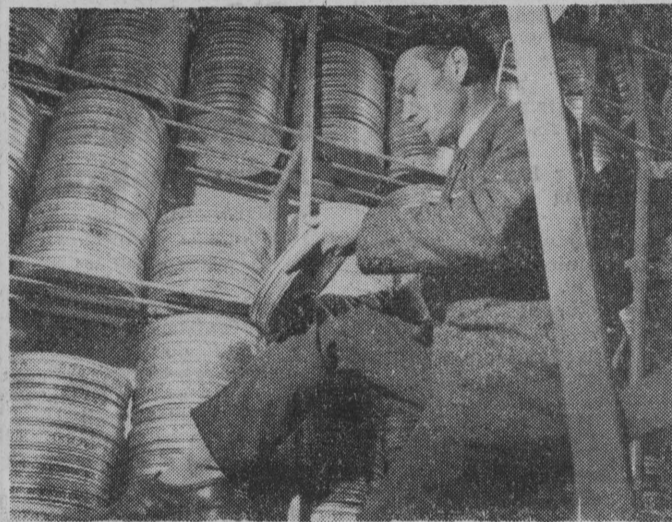
Polska Kronika Filmowa — ciesząca się już od lat zasłużonym uznaniem i powodzeniem — obchodzi 20-lecie. Pierwszy jej numer ukazał się w Lublinie. Przez te 20 lat obejrzelśmy już 1400 numerów PKF, jak zawsze żywych, atrakcyjnych, skomentowanych trafnym i dowcipnym tekstem. NA ZDJĘCIU: oto jak wygląda wnętrze magazynu negatywów.