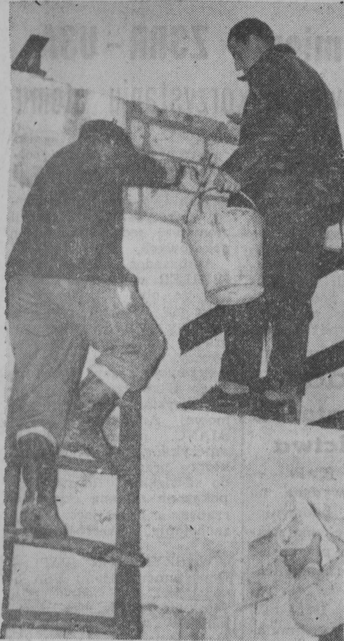
W całym kraju członkowie ZSL podjęli na czesie IV Kongresu wiele cennych zobowiązań. W wyniku realizacji czynów powstały nowe drogi, urządzenia kulturalne, baseny dla akcji przeciwzaparowej, remizy strażackie. NA ZDJĘCIU: budowa remizy strażackiej we wsi Pokrzydowo.