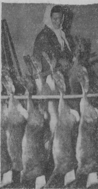
Zające po koniecznych zabiegach kosmetycznych wysyłane są do chłodni, a stamtąd na eksport.