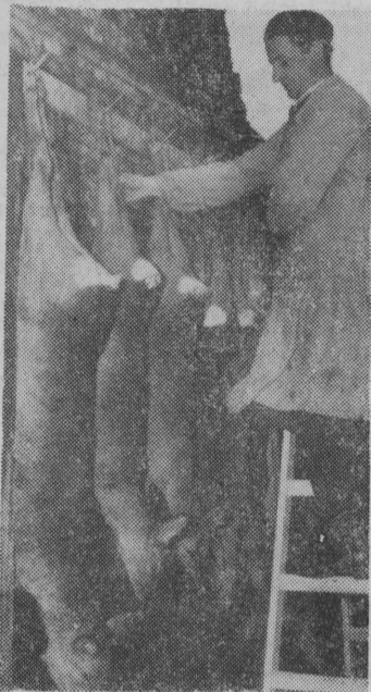
Sarny przygotowane do wysyłki za granicę.