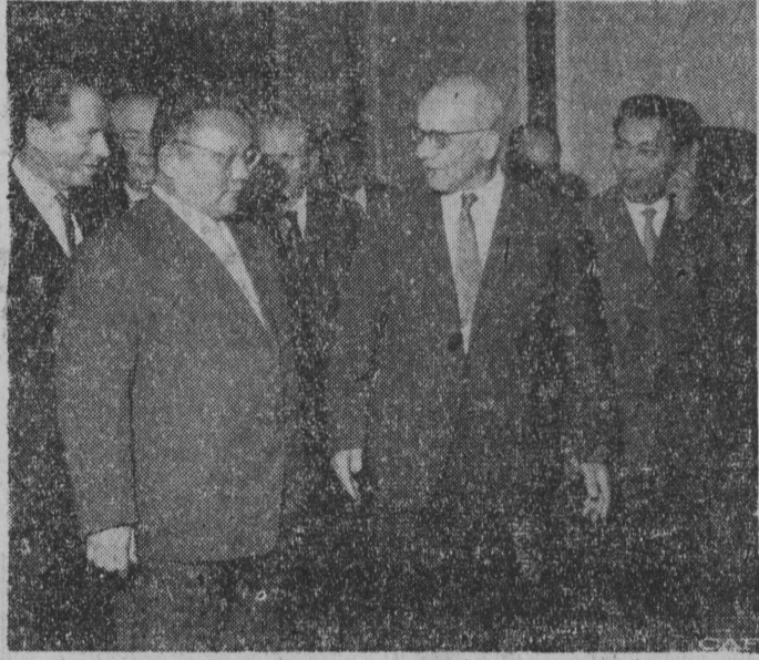
W dniu 23 bm. przewodniczący delegacji partyjno-rządowej Mongolskiej Republiki Ludowej I sekretarz KC Mongolskiej Partii Ludowo-rewolucyjnej i przewodniczący Rady Ministrów MRL Jumżajgin Cedenbał złożył w gmachu KC PZPR wizytę I sekretarzowi KC PZPR Władysławowi Gomułce i prezesowi Rady Ministrów, Józefowi Cyrankiewiczowi.

Po południu delegacja MRL wzięła udział w obiedzie wydanym na jej cześć przez gospodarzy województwa gdańskiego.