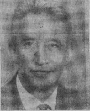
Naukowiec kosmonauta Konstanty Piotrowicz Feoktistow.