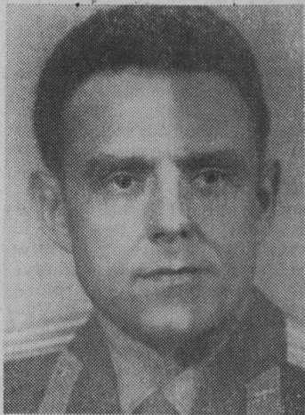
Pilot statku kosmicznego „Woschod” inżynier Włodzimierz Michajłowicz Komarow.

Nr 254 (4105) Środa, 14. X. 1964r. Cena 50 gr