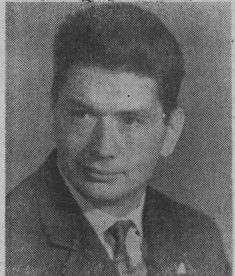
Lekarz kosmonauta, Borys Borysowicz Jegorow.