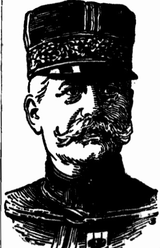
GEN. SARAIL, dowódca wojsk francuskich w Syrii, otrzymał dysmisję za barbarzyński stosunek do Druzów i bombardowanie Damaszku.

Ogólne wyniki przedstawiają się jak następuje: Partja Pracy — 230, inne partie razem — 488 mandatów.