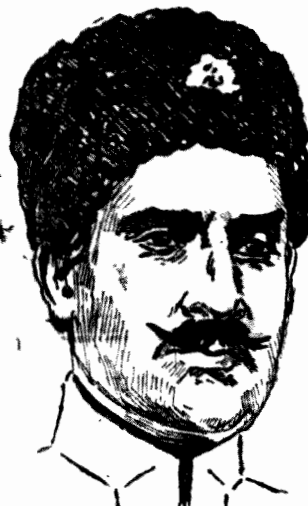
REZA KHAN Nowo wybrany władca Persji przybrał tytuł króla.