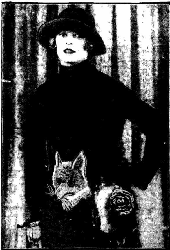
OZDOBA DAMSKICH KOSTJUMÓW