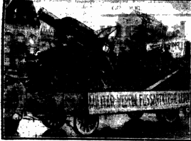
Cafe Niemcy usłane są tysiącami organizacji wojskowych, ukrytych pod najrozmaitszymi szyldami. Na fotografii widzimy agitacyjny wóz „wojskowego związku artylerji pieszej”, demonstrowany w Lipsku.

Już sam obrazek dosadnie charakteryzuje istotne tendencje i charakter tych związków.