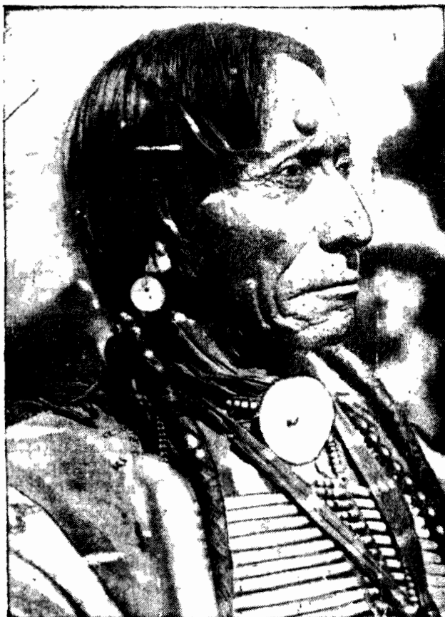
Oryginał, portret starego Indianina wykonany przez jednego z najmłodszych malarzy amerykańskich.