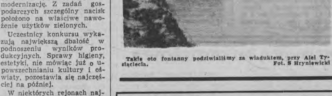
Takie oto fontanny podziwialiśmy za wiaduktem, przy Alei Tyściałecia.

W niektórych rejonach najgorętszy okres żniw dobiega końca. Najwyższy czas aby aktywni i działacze wiejskiej władzy, pomyśleli o obowiązkach wynikających z konkursu, a przyjętych przecież do browolnie. (zj)