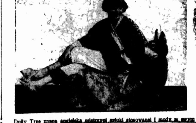
Dolly Tree znana angielska mistrzyni sztuki stosowanej i mody w nowym warszawskim kostiumie