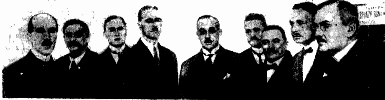
Fotografia nasza przedstawia rząd niemal w komplecie, nie widzimy jedynie dwu ministrów: Skrzyńskiego i Sikorskiego. — w chwili, gdy wchodzi do sali obrad sejmowych.

„Wyzwolenie” zgłasza wniosek o votum nieufności dla rządu i rozwiązanie Sejmu