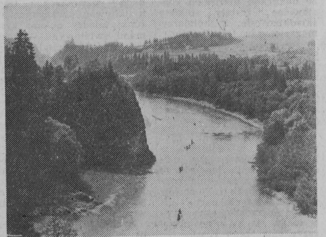
NA ZDJĘCIU: splyw Dunaicem — w głębi z lewej Niedzica.