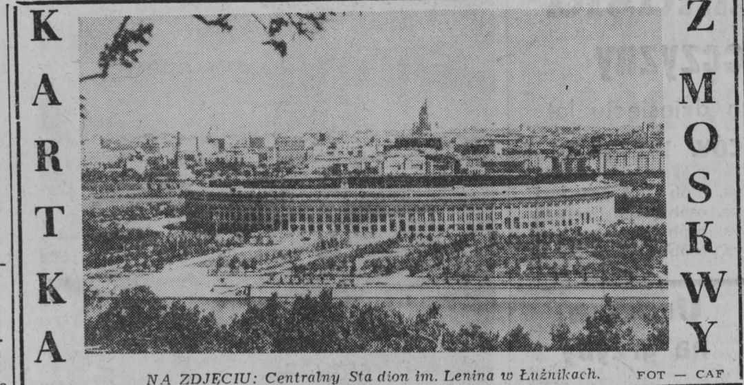
NA ZDJĘCIU: Centralny Stadion im. Lenina w Łużnikach.

RIO DE JANEIRO (PAP) 21. 6. Jak donosi z Chile, wskutek gwałtownego trzęsienia ziemi, które nawiązało w poniedziałek położone w południowej części tego kraju miasto Valdivia, ostatnie ocalałe budynki tego miasta runęły.