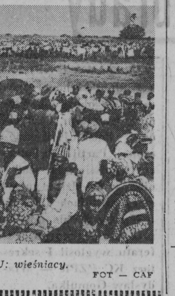
NA ZDJĘCIU: wieśniacy.