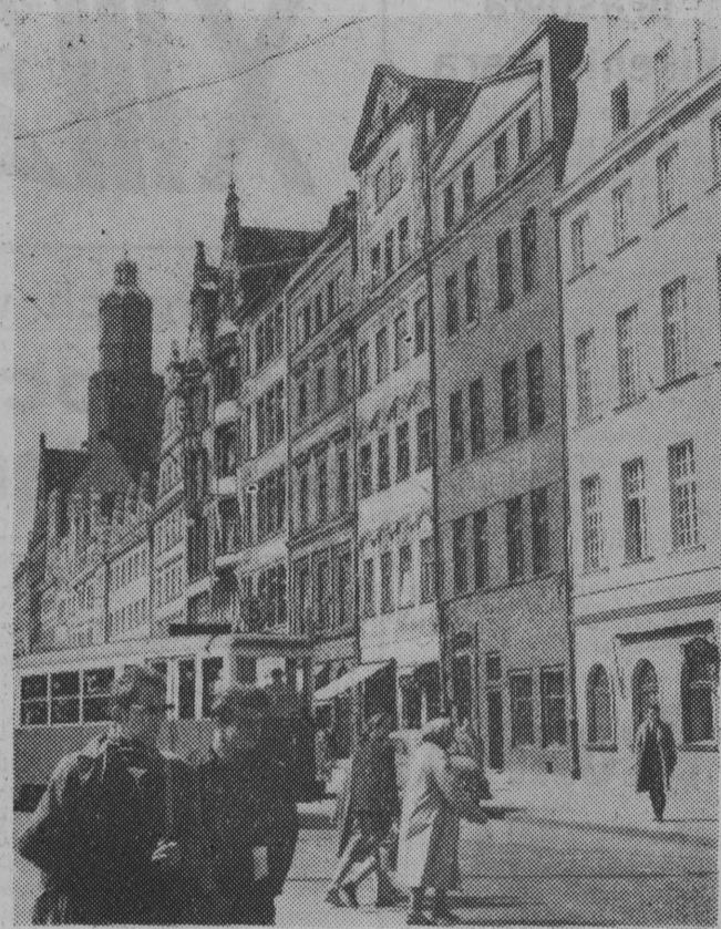
NA ZDJĘCIU: na wrocławskim rynku.