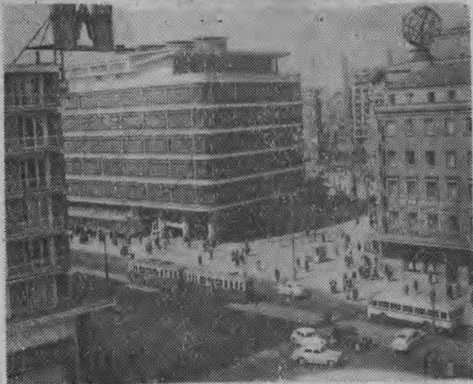
Róg ul. Brackiej i Al. Jerozolimskich.