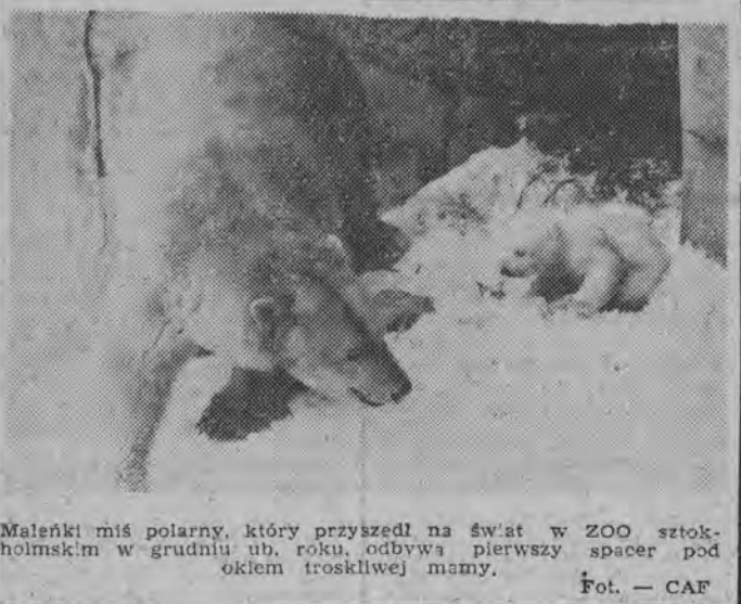
Małeńki miś polarny, który przyszedł na świat w ZOO sztokholmskim w grudniu ub. roku, odbywa pierwszy spacer pod okiem troskliwej mamy.

Z miłości do dziewczyny dwóch turystów włoskich postanowiło wykopać się w wielkiej „Fontana di Trevi” w Rzymie. Kto dłużej wytrzyma w zimnej wodzie, ten będzie szczęśliwym mężem. Niestety, historia znalazła swój epilog w komisariacie policji. (r)