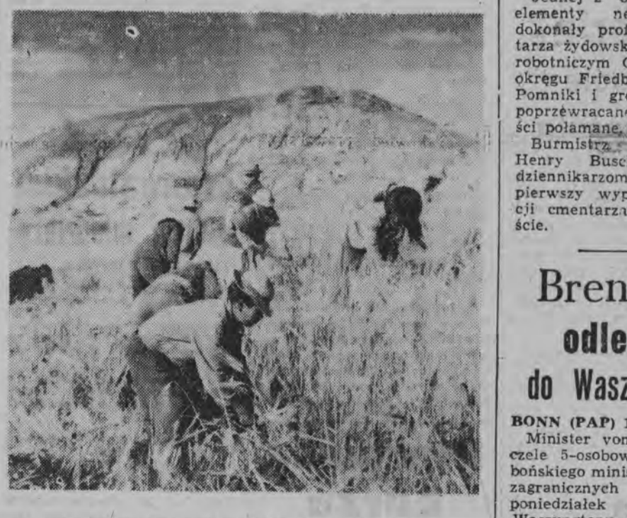
W trzech państwach Ameryki Łacińskiej - Boliwii, Ekwadorze i Peru żyje w Amazonii do stu tysięcy Indian. NA ZDJĘCIU: Indianie rejonu Rio Broma w Amazonii zbierają z pola jęczmień.