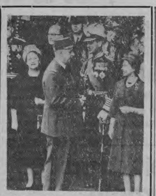
Z pobytu prezydenta de Gaulle'a w Londynie. NA ZDJĘCIU: prezydent de Gaulle w rozmowie z królową Elżbietą. Obok pani de Gaulle i księżę Filip.

JEST ROK 1940. Na Litwie ustanowiona została władza radziecka. Rakunas wstępuje do nielegalnej antyradzieckiej organizacji politycznej o nazwie "Lituwos