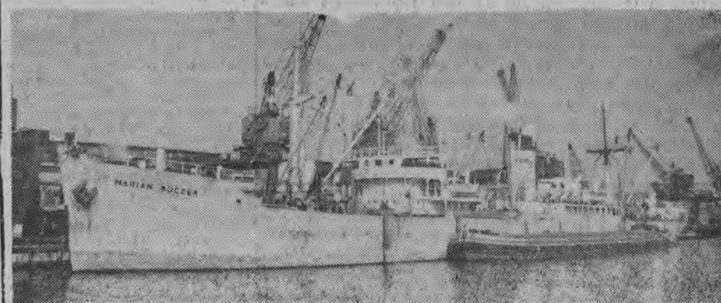
CAF — fot. Uklejewski