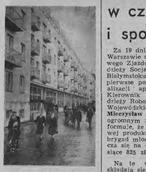
Stalinabad (Tadżycka SRR) — nowe domy mieszkalne na ul. Lenina.

badania kosztowały około pół miliona funtów szterlingów wyłożonych przez firmy angielskie, francuskie i amerykańskie, które zamierzają utworzyć przedsiębiorstwo budowy tunelu, jeśli jego projekt zostanie przyjęty. Koszt budowy ocenia się na około sto milionów funtów.