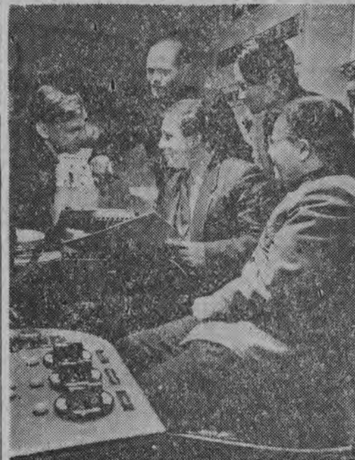
NA ZDJĘCIU: grupa pracowników naukowych Instytutu Wysokich Energii, którzy brali udział w pracach związanych z odkryciem nowej cząstki „anty sigma minus hiperon”.

W jutrzejszym, czwartkowym numerze „Gazety Białostockiej” opublikowany zostanie interesujący artykuł red. A. Omiljanowicza pt. „Wymowny epilog opowieści CIEN GILOTYNY”