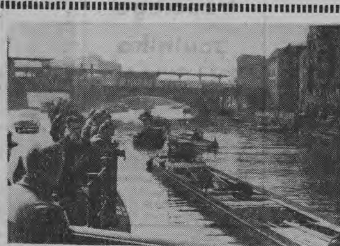
Nawet wiecznie spieniący się berlińczyk przystają na moście, by popatrzeć na uroczony ruch na rzecz...