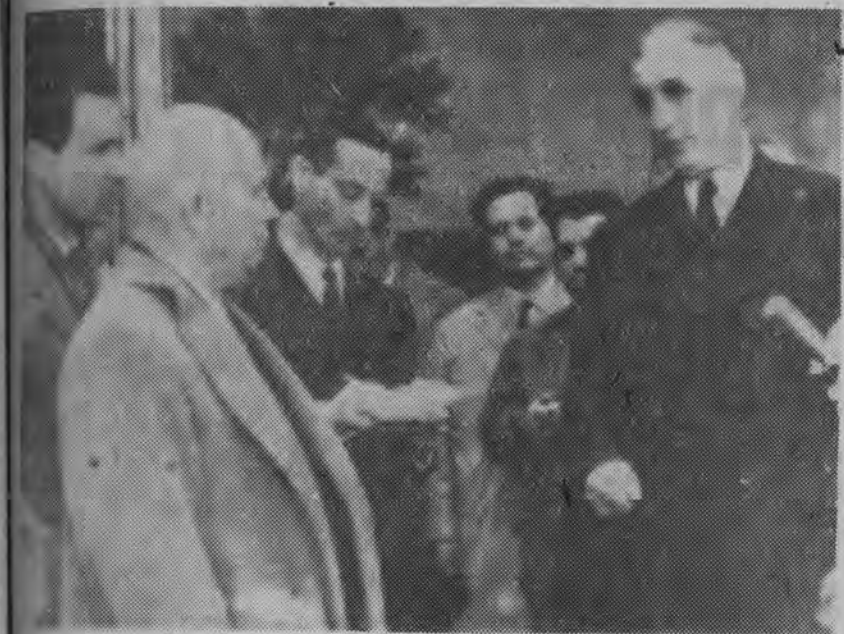
NA ZDJĘCIU: prezydent de Gaulle wita premiera Chruszczowa na lotnisku.