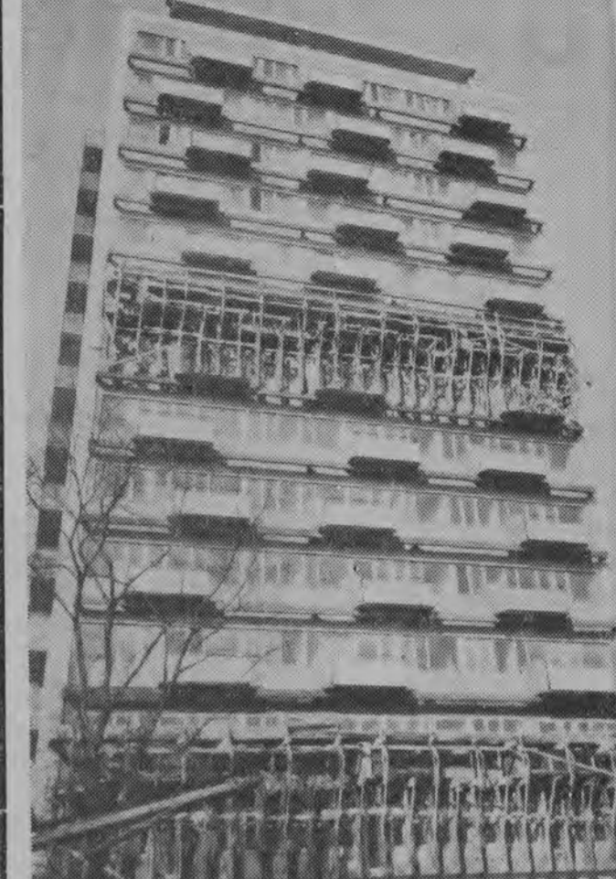
WARSZAWSKIE WIEZOWCE SA FOTOGNICZNE... NA ZDJĘCIU: oto zdjęcie wieżowca przy ul. Wiejskiej.