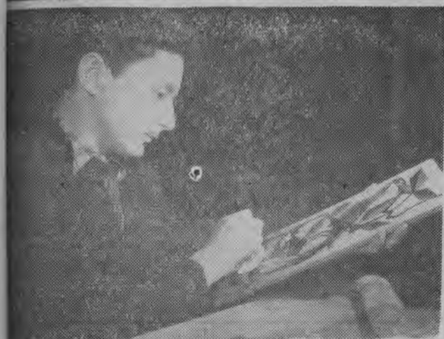
Kasyno Szkoła Zawodowa w Hajnówce kształci nowe kadry metalowców. W dziedzinie drzewnym uczniowie, którzy posiadają uzdolnienia artystyczne, wykonują ciekawe prace. NA ZDJĘCIU: jeden z uczniów kolekcje wykonane przez siebie.