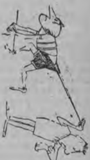
Uwaga na start!