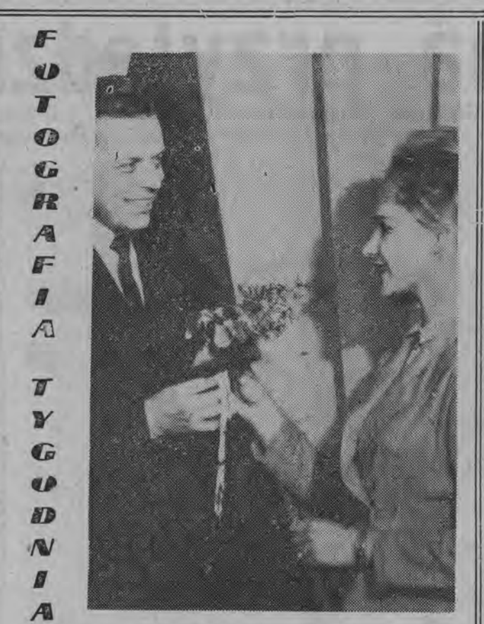
W Dniu Kobiet - najlepsze życzenia i kwiaty...

W tym samym czasie plan operacyjny skupu żywności wykonano w 63,2 proc.