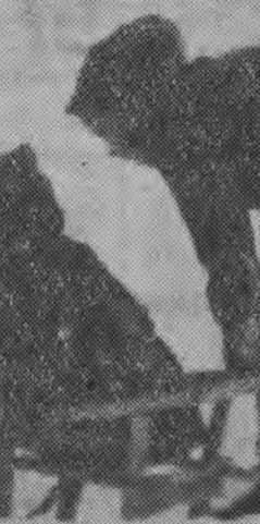
Z górk na pazurki