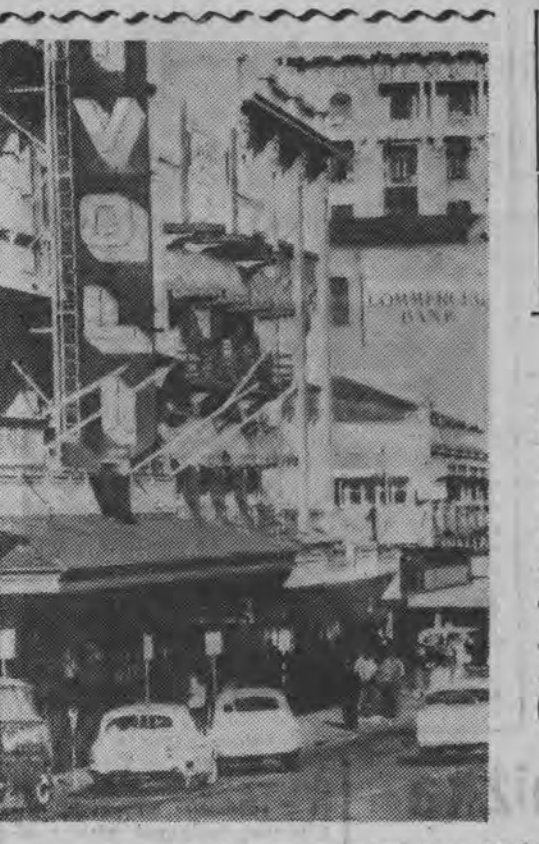
Objektywem przez świat

Proces o zatruciu ryb - odroczone Jak już informowaliśmy naszych Czytelników, do Sądu Wojewódzkiego w Białymstoku wpłynął pozew Polskiego Związku Wędkarskiego, domagający się odszkodowania od Biłostockich Zakładów Roszniczych w wysokości 350 tys. złotych za zatrucie w roku ubiegłym naszych Czytelników.