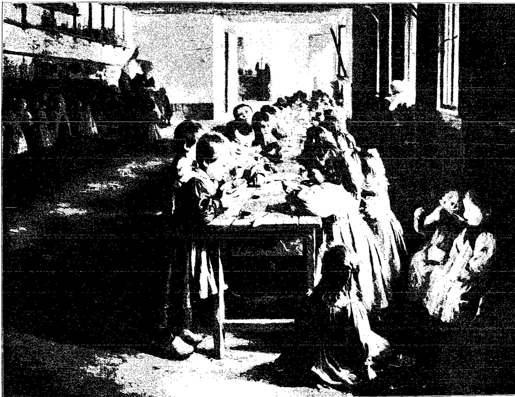
E. HERLAND. „PODWIECZOREK W PRZYTULKU“. ALBUM „KRAJU“