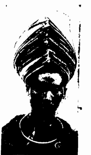
Młodzież koreańska nosi olbrzymią wysokość zawoju z jedwabiu mieniącego się wszystkimi barwami tęczy. Im więcej kolorów i im wyższy turban — tym eleganściej młodzieńca.