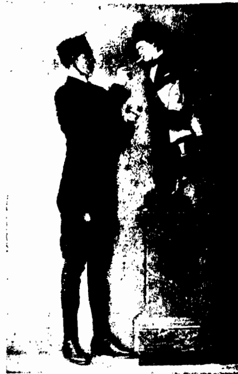
podziwana na ulicach Paryża