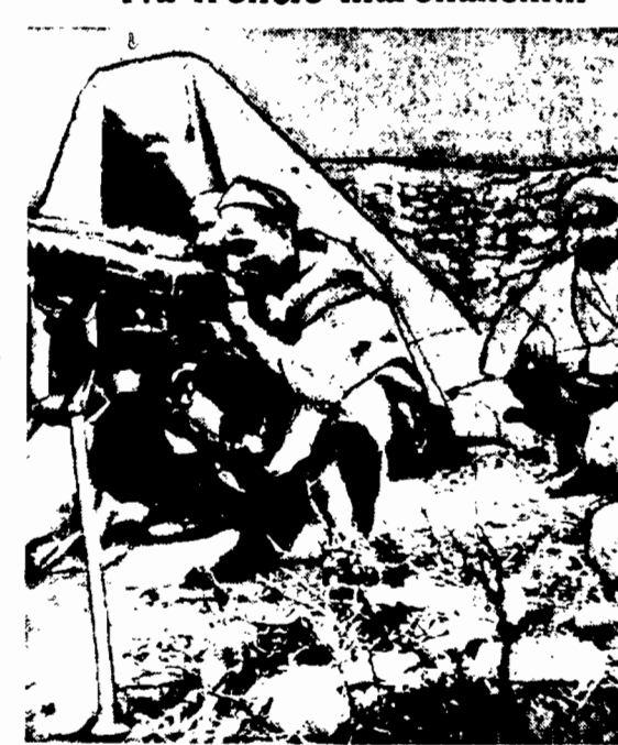
Karabin maszynowy Kabyłów mierzy w atakujące kolumny hiszpańskie.