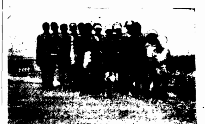
ZBIOROWE WESOŁE FOTOGRAFJE. pozostaną miłymi wspomnieniami ostatnich dni spędzonych na polskim brzegu Wielkiej Wsi, Jastarni i innych najpiękniejszych plażach Bałtyku.