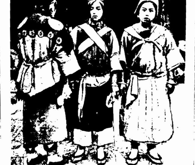
Fotografia przedstawia typy nieamerykańskich chinek z Mongolii.