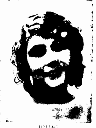
DELIAĆ znana francuska artystka kinematograficzna.