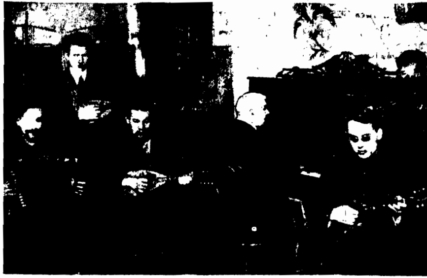
W siedzibie ociemniałych ofiar wojny najmilszą rozrywką i naj-

większą przyjemnością jest muzyka. Zdjęcie przedstawia orkiestrę ociemniałych: trzech mando-