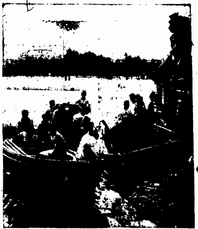
W Gdyni odbyły się w niedzielę po raz piąty z rzędu regaty morskie, które cieszyły się ogromnym powodzeniem zarówno wśród bawiących nad morzem letników, jak i przybyłych z całej Polski gości.