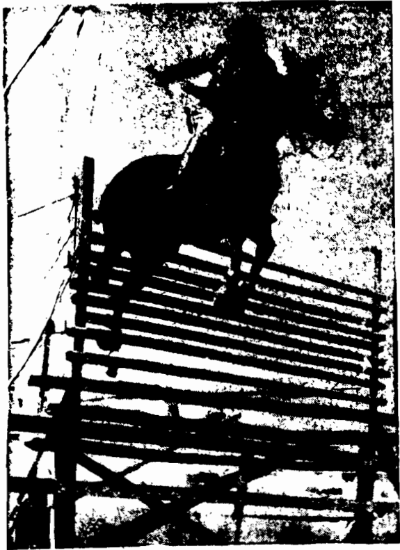
Słynny amerykański koń wyścigowy "Kings Awn" trenuje w New - Jersey przed próbą pobicia rekordu światowego w skoku w w. y. z. Dziecię nasze przedstawia skok przy wysokości 7 stóp 8 cali (2 m. 10 cm.). Rekord wysokości wynosi 8 stóp 1 1/2 cali (2 m. 68 cm.). A więc została jeszcze różnica pokazania.