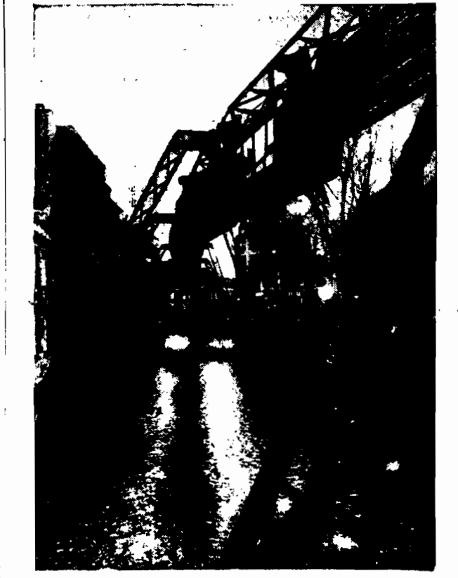
Eberfeld, miasto niemieckie obchodzi 25 lat. Mój Boże, kiedy to u nas obecnie uroczysty jubileusz: dwudziestolecie w Warszawie, urządzimy nie wspaniałe swoje kolejkę powietrzną. Rozciągnijmy takiej arterji komunikacyjnej.