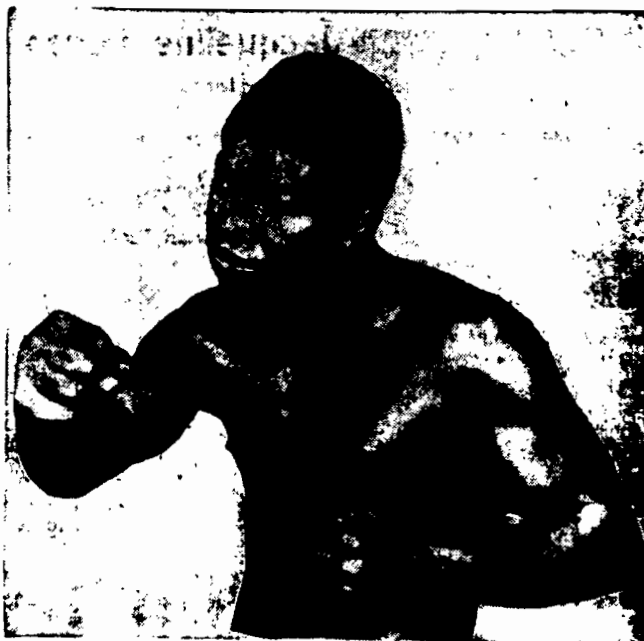
MISTRZ BOKSU W AMERYCE, MURZYN SAKI