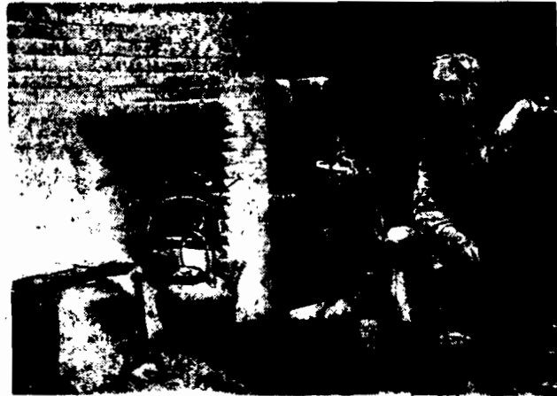
Henryk Ford, najbogatszy człowiek w Ameryce, jest znanym wrogiem teatralnym. Fotografia powyższa jest jedyną, jaką zrobiono za przyzwoleniem Forda w jego letniej rezydencji, zbudowanej na wzór starożytnego zamku.