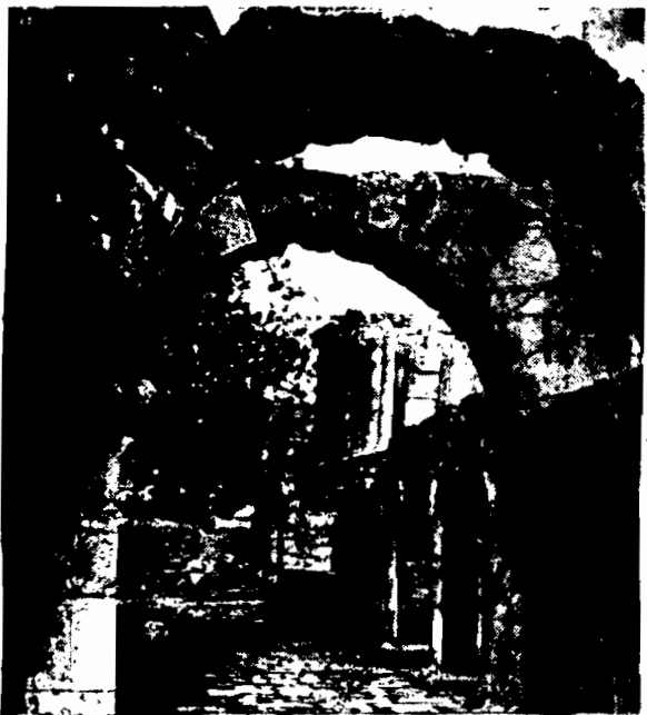
Ekspedycja naukowa francuska dokonała wykopaliska starożytnej Kartaginy, zburzonej przez Rzymian. Na ilustracji naszej widać jedną z najlepiej zachowanych ulic, a w głębi świątynie Septima Sewera.