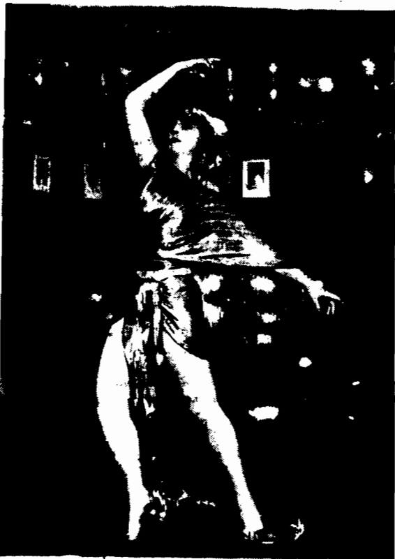
W STRADY PARYSKIEJ Zaskoczona tancerka rosyjska, występująca obecnie w teatrach paryskich pod pseudonimem „Nastia”. Pod tym skromnym pseudonimem kryje się podobno wysoka sroczona arystokratka rosyjska. Fotografia przedstawia Nastię podczas ćwiczeń domowych. Cały strój tancerki składa się ze sztywnych jedwabiu, misternie uplecionego.