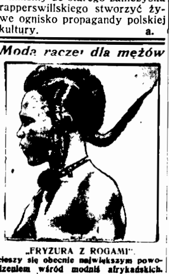
„FRYZURA Z ROGAMI” — ciekawy jest obecnie największym powodzeniem wśród modniarzy afrykańskich.