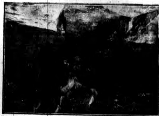
Prace wykopaliskowe i konserwatorskie w Trembowli