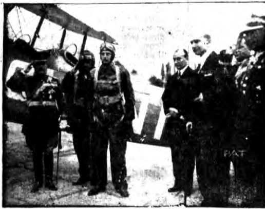
Ks. Mikołaj rumuński w Warszawie

Onegdaj wieczorem przybył do Warszawy ksiądz Mikołaj rumuński, brat króla Karola II. Na pierwszej ilustracji widzimy ks. Mikołaja tuż po opuszczeniu samolotu, w otoczeniu p. n. n. Spraw Zagranicznych A. Zaleskiego i generalicji polskiej i rumuńskiej śpiewającego hymnu narodowego rumuńskiego, odegranego przez orkiestrę 30 p. p. Na zdjęciu drugim—wyżsi oficerowie polscy i rumuńscy na ciele przed przybyciem ks. Mikołaja.