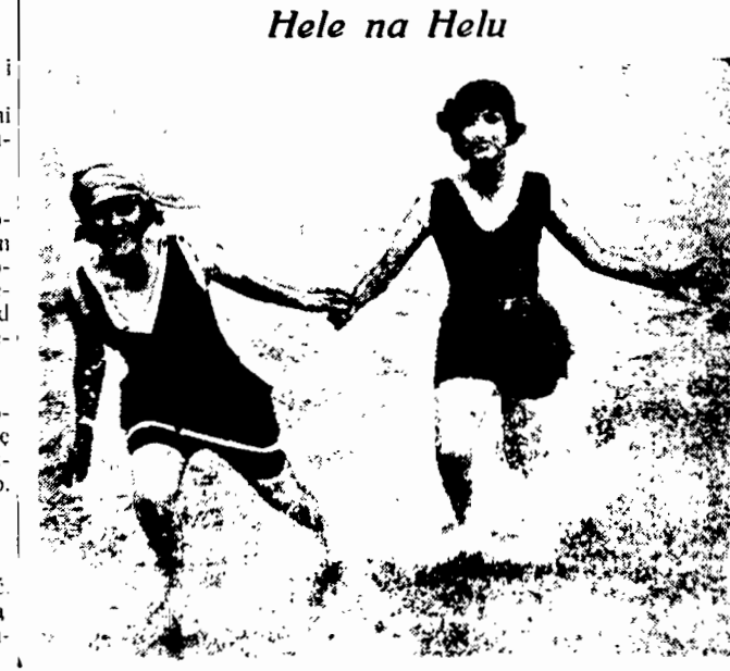
Hele na Helu