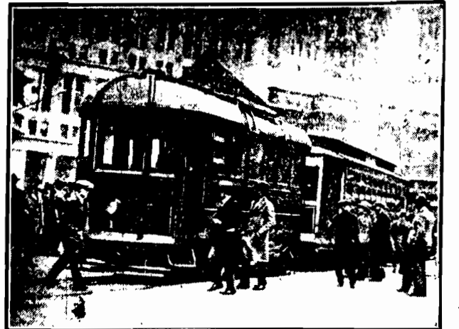
ZAMIAST ELEKTRYC ZNOŚCI — GAZOLINA

Nowy Jork wprowadza nowy typ wagonów tramwajowych, poruszających się za pomocą motorów gazolinowych.