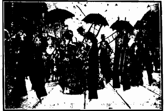
na ulicach Berlina