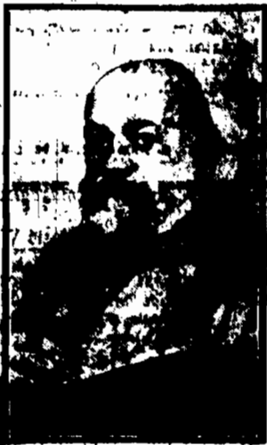
ZMARŁ W RZYMIE W DNIU 28 KWIECIEŃ

Zmarł jeden z wybitniejszych, cieszących się sławą europejską malarzy polskich, był twórcą wielkiej panoramy „Bławy pod Racławicami”. Mieszkał ostatnio we własnej pięknej rezydencji w Capri. Zmarł podczas odwiedzin zięcia swego wskutek ataku sercowego. Zyl lat 68.