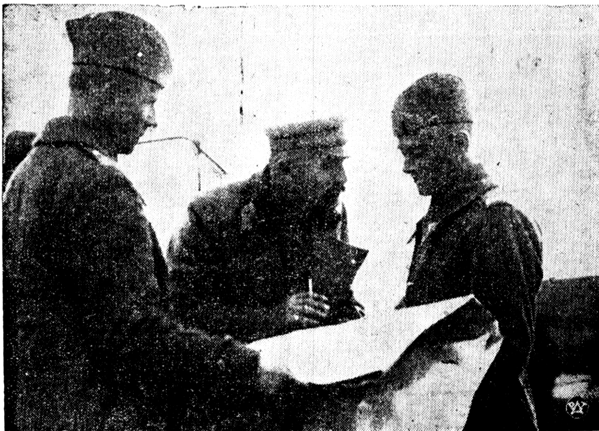
Marszałek Piłsudski i Marszałek Śmigły Rydz w czasie walk o Wilno

wo, jeden w lewo a inny znów, zdzieleniały przyk, odmierzalby na centymetry znaczenie Wodza i Jego uprawnienia w Państwie... Aż dziw bierze, że dotychczas nie wzięło się krótko, za pyski tych panów „arystokratów... demokracji”, że pozwala się im tumanić obywateli, żeć za