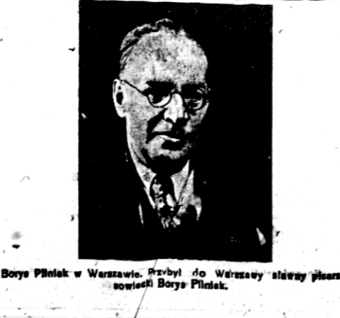
Borys Piliak w Warszawie. Przybył do Warszawy sławny pisarz sowiecki Borys Piliak.

Bilans i rachunek strat i zysków zostały zatwierdzone przez Walne Zgromadzenie Akcjonariuszów dnia 7 stycznia 1931 r. Powyższe Walne Zgromadzenie uchwaliło zysk za rok operacyjny 1929-30 zł. 11.628,79 przełać na kapitał rezerwowy spółki.