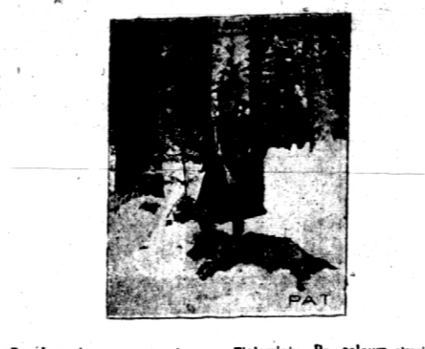
Z polowania reprezentacyjnego w Białymstoku. Po celnym strzale.

W sprawie tej, w dniu 17 stycznia 1930 r. w miejscowości Siedlisko, powiatu Siedliski, został zamordowany b. zastępcą inspektora szkolnego Stadnik. W sprawie tej, w dniu 17 stycznia 1930 r. w miejscowości Siedlisko, powiatu Siedliski, został zamordowany b. zastępcą inspektora szkolnego Stadnik.