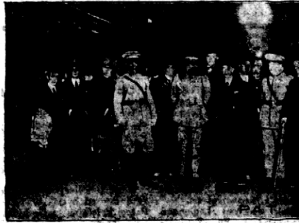
Przyjeżdża Pan Marszałek Piłsudskiego do Lizbon. Na dworcu kolejowym w Lizbonie powitał Pana Marszałka Piłsudskiego minister wojny (z prawej) i minister spraw zagranicznych Portugalii.

Z zestawienia tego wynika, że rok ubiegły przyniósł tej dziedzinie sportu aż 30 rekordów, ustanowionych wyłącznie na ziemiach Starego Świata. Pierwsze miejsce we wspomnianej statystyce zajmują Niemcy z liczbą punktów — 1677 5, 2) Finlandia, 3) Szwecja, 4) Anglia, 5) Francja, 6) Węgry, 7) Norwegia, 8) Włochy, 9) Holandia, 10) Irlandia, 11) Polska (147 5 pkt.), 12) Danja, 13) Czechosłowacja, 14) Rosja, 15) Austria, 16) Estonia, 17) Litwa, 18) Grecja, 19) Szwajcaria, 20) Rumunia, 21) Belgia i 22) Jugosławia.