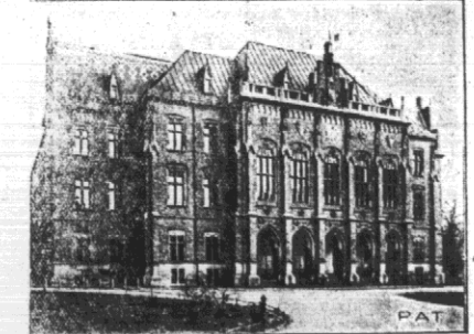
Najstarszy w Polsce uniwersytet. — Uniwersytet Jagielloński w Krakowie, jest nawet jedną z najstarszych w Europie. Powstał z królowego w r. 1364 przez Kazimierza Wielkiego studium generale, które posiadało 4 wydziały: sztuk wyzwolonych (aritm.), medycyny, prawa. Studium generale oparł było na systemie włoskim. Rektora wybierali uczniowie. W r. 1400 królowa Jadwiga zreorganizowała akademię, przekształcając ją na szkołę partykularną. Przybyły wtedy wydział teologiczny. Władza zależała na szczyt partykularnej pałacu. Rektor był wybierany przez profesorów. Za czasów Komisji Edukacyjnej Uniwersytet Jagielloński otrzymał nazwę „Główniej Szkoły Koronnej” — powstały wtedy dwa kolegia: moralne (teologia, prawo, literatura), fizyczne (matematyka, fizyka, medycyna). W roku 1900 Uniwersytet Jagielloński obchodził jubileusz 500-letnia istnienia.

Zmniejszenie budżetu osiągnięte przez zastosowanie oszczędności w wydatkach administracyjnych państwa, które w grupie wynoszą 2 384 miliony zł. Reszta preliminarzowych wydatków w budżecie wynosi 500 milionów zł. W tej sumie znajdują się wydatki nadzwyczajne w wysokości około 150 milionów zł. Cała więc działalność całego aparatu państwowego poza normalnym urzędowaniem, otrzymuje do dyspozycji sumę tylko 350 milionów zł. Za tę sumę musimy utrzymać drogi, prowadzące reformę rolną, prowadzić profaktykę sanitarną, udoskonalać rolnictwo i t. d. Z powyższego przedstawienia wynika, że zmniejszyć budżet po stronie wydatków o znaczną kwotę, stałoby w rzeczywistości, można byłoby tylko drogą zmniejszenia wydatków personalnych — co równa się zmniejszeniu uposażeń urzędniczych. Rząd jednak nie ma zamiaru iść tą drogą. Zbliża uposażenia urzędniczych, mogłyby być przeprowadzone tylko w obliczu katastrofy deficytu. Na szczęście, dzięki przestorności Rządu pomniejszając Rząd obecny rozpoznaje, że posiada rezerwy skarbowe, któreś to na nam więc nie grozi. Tem niemniej, wszelkie pomysły podwyższenia pensji urzędniczych należy w obecnej sytuacji nie owożać, jeżeli chodzi o podwyższenie wydatków budżetowych, czy będą one z zasady podporządkowane do zmniejszenia tych wydatków. Z tego