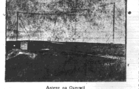
Anten w Okryw