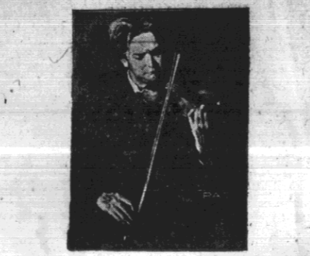
Kidon - „Skrzypek”