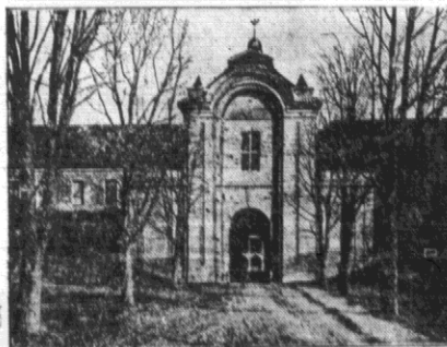
Widok z ul. K. w u. ordynacji Raczkiewiczów w Otyce