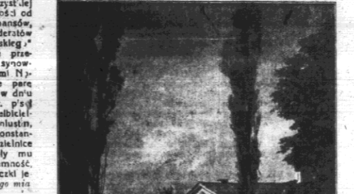
Wielkiemu twórcy, który w sposób zniuansowany, a nie w sposób jednoznaczny, wyrażał swoje poglądy na temat Polaków...