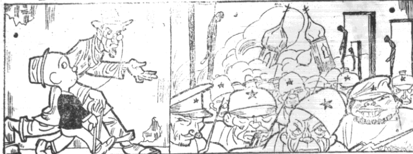
Przec z N.-D. przec z socjalist! Może lepszy komunista... Myśli Felus zszczęśliwiony... Ten lud już zszczęśliwiony...