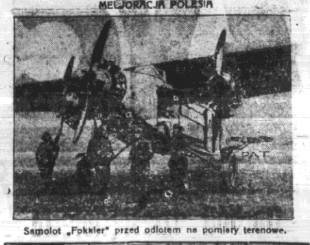
Samolot „Fokker” przed odlotem na pomieszczenia terenowe.

Dziesiątowiecie odparcia najeżdź... Dzień 11 listopada b. żołnierzy manifestowało wczoraj swoje przywiązanie do Polski w pow. stoniemskim... (Tel. od wt. kor. z Słoniemiu)