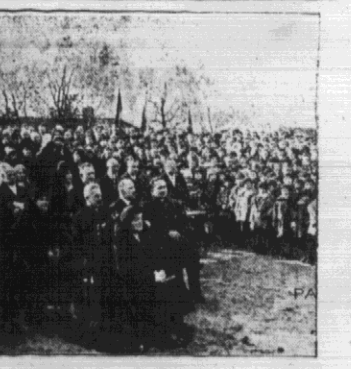
Pani Marszałkowna Piłsudska na uroczystości odsłonięcia pomnika w Wawrze

Centrowemu, „dla czegoś pojechał“ odpowiedział, że mówiono, iż będą dążył w czasie obrad do podwyższenia cen, na zboże, lub do uwolnienia Marszałka Piłsudskiego od jego otoczenia. To się prości państwa nazywa urabianiem nastrojów przedwyborczych. Albo daje się rzekomo do podpisania petycję o zwolnienie z Brześcia b. posła, a podpis używane są do list wyborczych. Jeżeli chodzi o nastroje wyborcze, zachodzi pytanie, jak ma się ustosunkować Rząd do wyborów. Może być ustosunkowanie bierno, to znaczy rozpisać się wybory i Rząd w żadnym wypadku nie traczy się o wyniki wyborów. Rząd, który biernie był się ustosunkowuje do akcji wyborczej, byłby zrzędem ślepych, Rząd, który dąży do ukształtowania życia na lepsze jutro, nie może biernie ustosunkowywać się do sprawy wyborów. Bo przez niepanstwo mogłyby naprzekład przy wyborach zwyciężyć partyj, którzyby następnie zająłi dła naprzykład zmiany granic Polski, albo partia, która by chciała ten zawiesz wierny Polsce gród, ten polski Lwów, oddać w inne ręce. Przenigdy! Rząd, który dąży do ukształtowania życia na lepsze jutro Polski, musi tak urabiać nastroje, by określić się o silne stronnictwo, które by w sposób zdecydowany wybrało w ten sposób rząd owe go państwa, starał się urabiać opinie i bywałe i nastroje przedwyborcze. My byśmy mogli zrobić również to samo, moglibyśmy rzucić odpowiedzialność