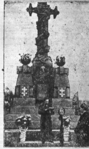
Pomnik poległych żołnierzy litewskich w Kownie. W Kownie z okazji 500-lecia śmierci Króla Władysława, odsłonięto pomnik poległych żołnierzy litewskich. Na uroczystości prezydent Smetona wygłosił antypolską mowę (rdz.).

BERLIN 6.XI. Kanclerz Bruening w godzinach wieczornych przyjął przedstawicieli Zielonego frontu, członków związku agrariuszy, którzy przodstawili kanclerzowi program swego ruchu. W Niemczech przedstawiłi żądania agrariuszy w kierunku udziału w pow. r. Kanclerz Bruening zaznaczył, że