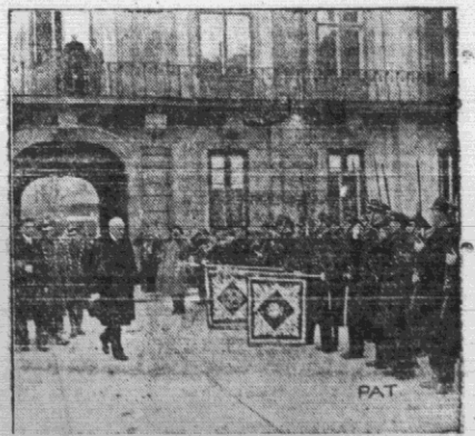
Święta księżka polskiego w Warszawie. W dniu swego święta oddział P.W. kolejarzy przybył na Zamek ze sztandarami, aby oddać hołd Panu Prezydentowi Rzeczypospolitej.