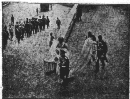
Młoda para w drodze do bazyliki S. Franciszka w Assyżu.