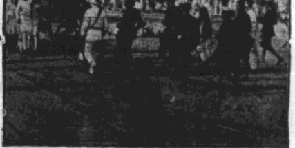
Zwolnienie Wschodniobudynku Kongressu w Bombaju z ostrzyli ruch separatystyczny Indji. Codziennie prasa donosi o starciach zbrojnych między tłumem a policją... Zamieszki w Indjach...