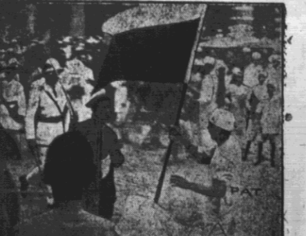
rolnicy odbierają manifestantów flagę o barwach Wschodniobudynku... Czytając „Zycie Nowogródzkie“...