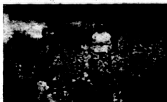
Rys. 8. Konkursowy ogródek kwiatowy.