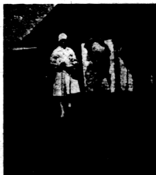
Rys. 9. Stado kur zielononózek konkursowych.