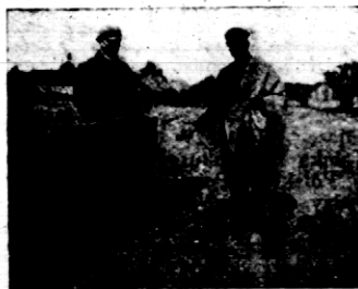
Rys. 4. Rozsiewanie nawozów sztucznych na poletku konkursowym.