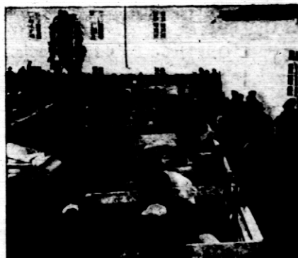
Rys. 16. Wystawa konkursowa.