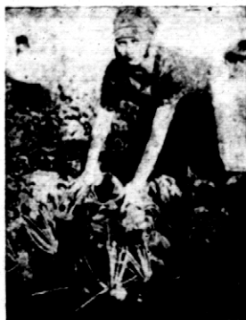
Rys. 7. Konkursowe buraki pastewne.