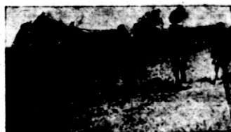
Rys. 2. Orka poletka konkursowego.