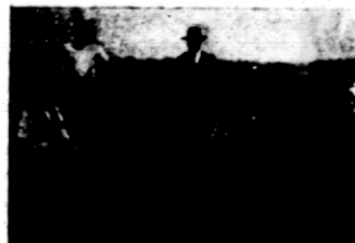
Rys. 13. Plon ziemniaków konkursowych przewyższa 400 ctn³ z ha.