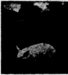
Rys. 17. Prosię konkursowe lubi czystość.