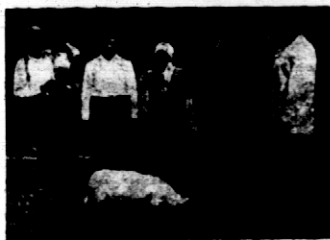
Rys. 10. Pupilek konkursowy.