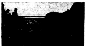
Rys. 3. Bronowanie poletka konkursowego.