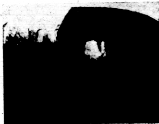
Rys. 5. Konk. poletko kukurydzy.