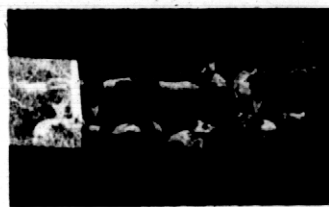
Rys. 1. Rozdanie prosiąt konkursowych.