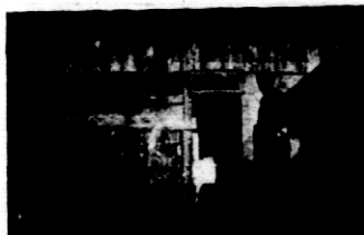
Rys. 11. Chlewik prosięcia wybielony, czysty z okienkiem.