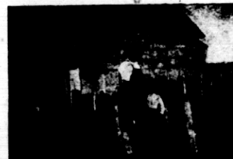
Rys. 6. Pomidory konkursowe.