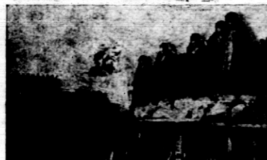
Rys. 15. Kapusta na wystawie konkursowej.