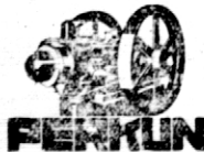
Motory przemysłowe do młynów, elektrowni i t. p.