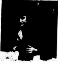
Rys. 12. Króliki konkursowe w pow. sarnieńskim.

Radjośluchacze Rolnicy! Czytelnicy ulotki Radjowej! Komisja Radjofoniczna Rolnicza przy Muzeum Przemysłu i Rolnictwa wypuszcza już w świat piętnastą ulotkę radjową. Dążąc jednak stale do ulepszenia tego wydawnictwa zapytuje czytelników czy ulotki te odpowiadają celowi, dla jakiego są wydawane, czy ilustrują należycie odczyty rolnicze i przy słuchaniu wykładów są przez radjośluchaczy użytkowane, jak również czy skróty wykładów są zrozumiałe i wystarczające. Komisja prosi o zgłaszanie wszelkich uwag listownie pod adresem: Muzeum Przemysłu i Rolnictwa, Komisja Radjofoniczna, Krakowskie Przedmieście 66.