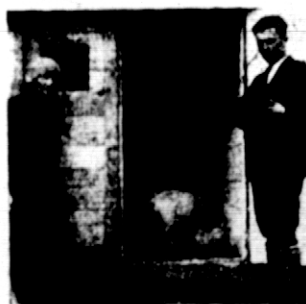
Rys. 7. Jak konkursista na Wołyniu urządził chlewek.