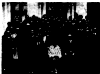
Rys. 3. Kurs przygotowawczy przedkursowy na Polesiu w pow. brzeskim w 1928 roku