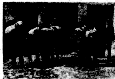
Rys. 8. Rozdawanie prosiąt konkursowych w pow. lubelskim w 1928 r.