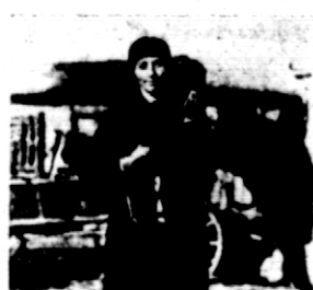
Rys. 6. Przyjaźń i przywiązanie pupilków konkursowych.