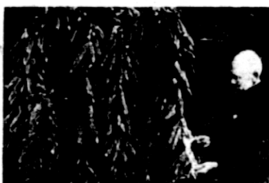
Rys. 2. Kukurydza wczesna bydgoska rozpowszechniona w Polsce przez konkursy młodzieży wiejskiej