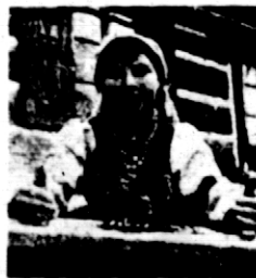
Rys. 5. Konkursistka z pow. łowickiego.