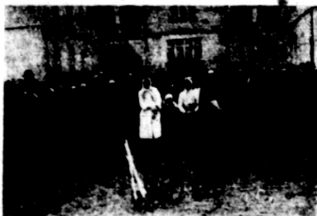
Rys. 1. Pokaz prac młodzieży wiejskiej w Łowiczu, w 1927 roku.