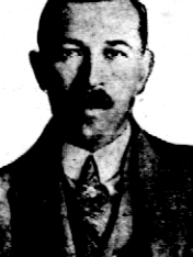
POSEL R. P. W. LIZBONIE.